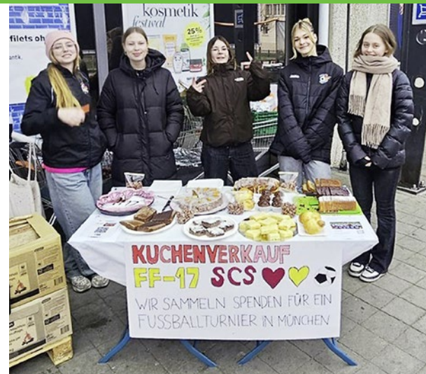
Kuchenverkauf Standort 1