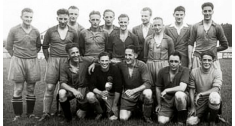
Regionalmeister 4.Liga 1951

nicht vorenthalten möchten. Leider sind uns nicht immer alle Fotografen und Beteiligten bekannt, aber sehen Sie selber: