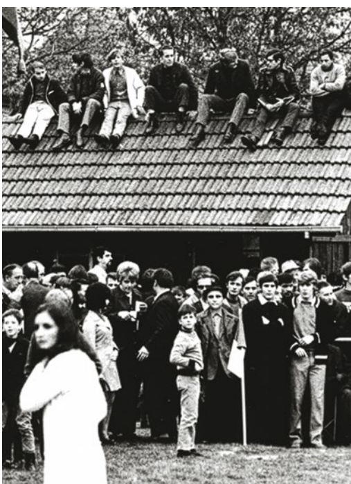
Zuschauerrekord 1977 im Hügeli