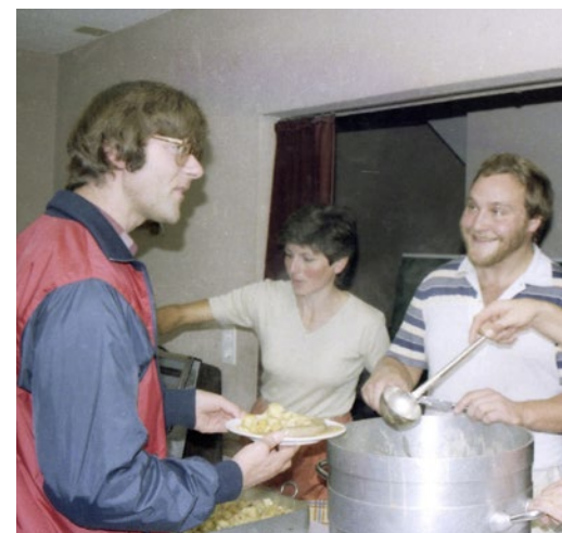
Essensausgabe Jula 1983 Bürglen