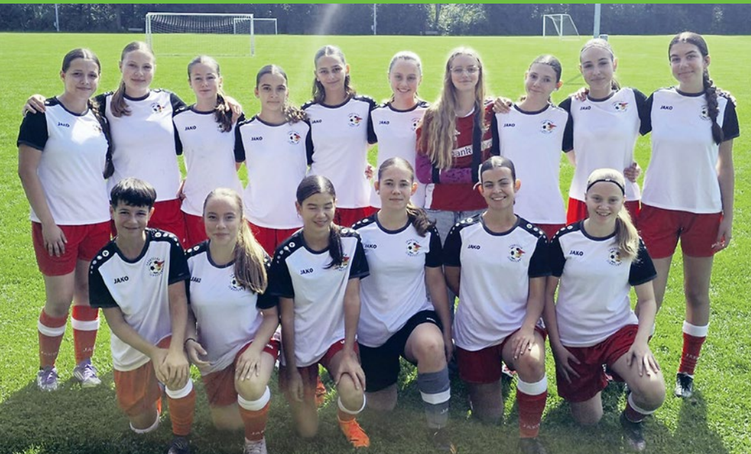
Wir SCS FF17