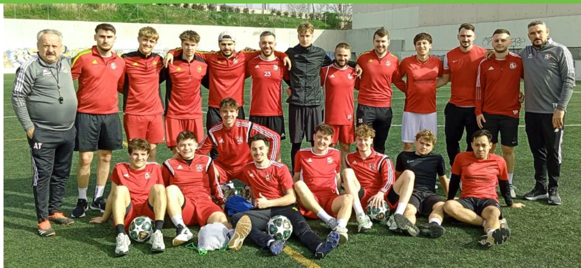
Die Mannschaft im Trainingslager in Madrid

Nach dem Training kehrten wir zurück ins Hotel. Um 13:00 Uhr machten wir uns mit einem Uber auf den