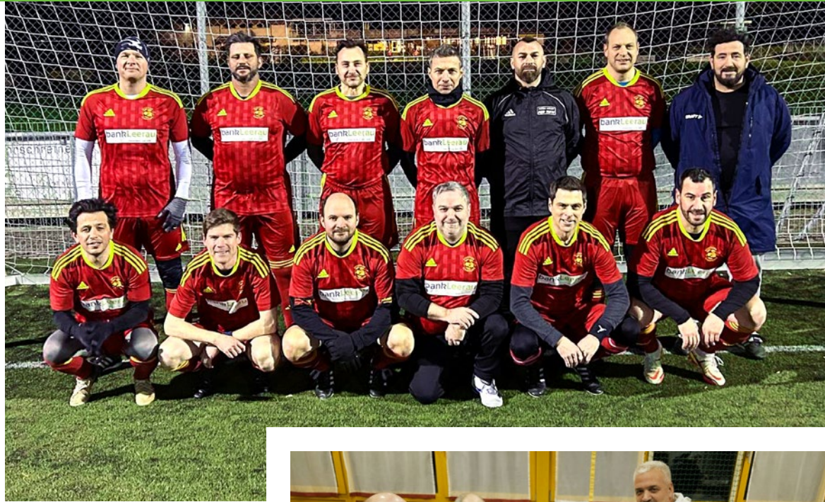
Senioren +40 Wintertestspiel 2026