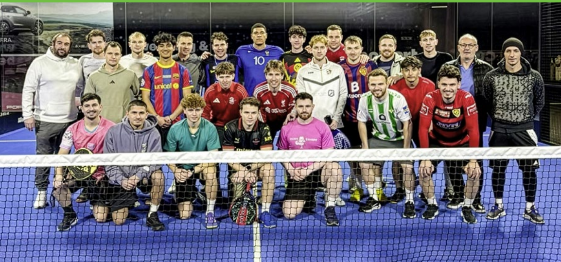
Das Trainingslager in Sevilla schweisste das Team noch mehr zusammen