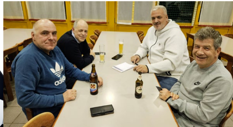
Trainergespann der 50+-Senioren