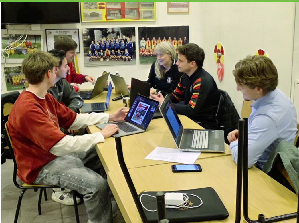
Das Marketing-Team des SC Schöffland

Alle vier bis sechs Wochen treffen wir uns, um neue Ideen zu entwickeln, bestehende Konzepte zu hinterfragen und neue Ansätze zu prüfen – immer mit dem Ziel, unseren Verein nachhaltig zu stärken. Wie zum Beispiel mit dem neu integrierten Onlineshop mit unserer eigenen Kollektion.