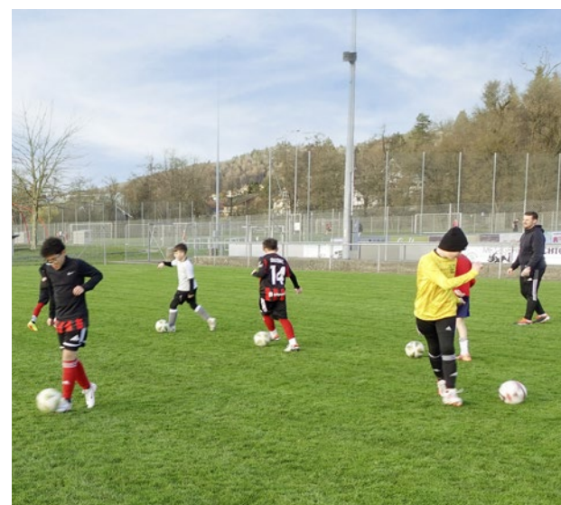
Besuch im Training