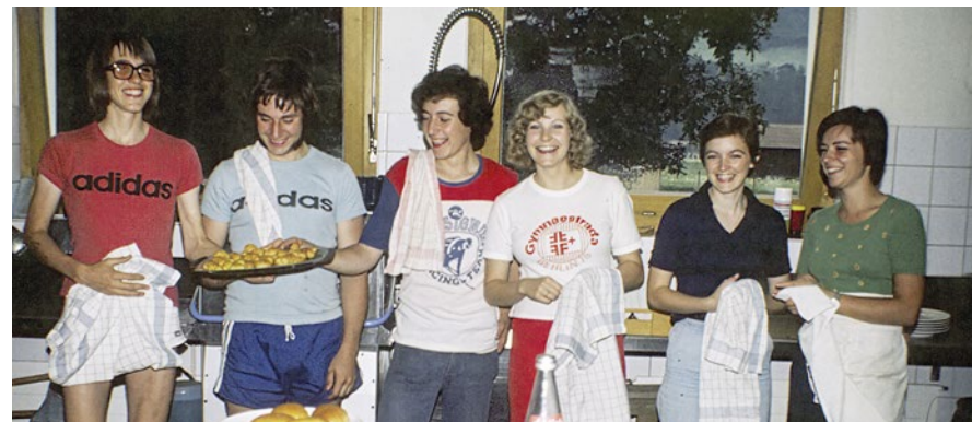
Küchencrew Jula Frutigen 1975