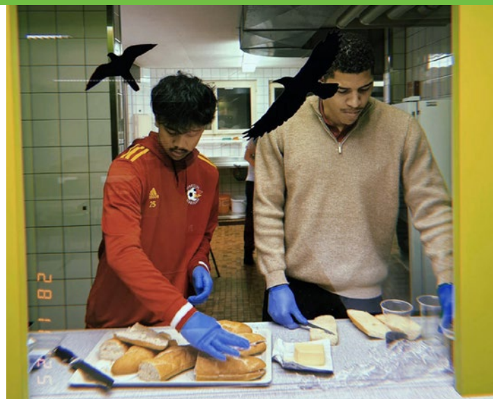
Spieler der 3. und der 1. Mannschaft gemeinsam im Einsatz