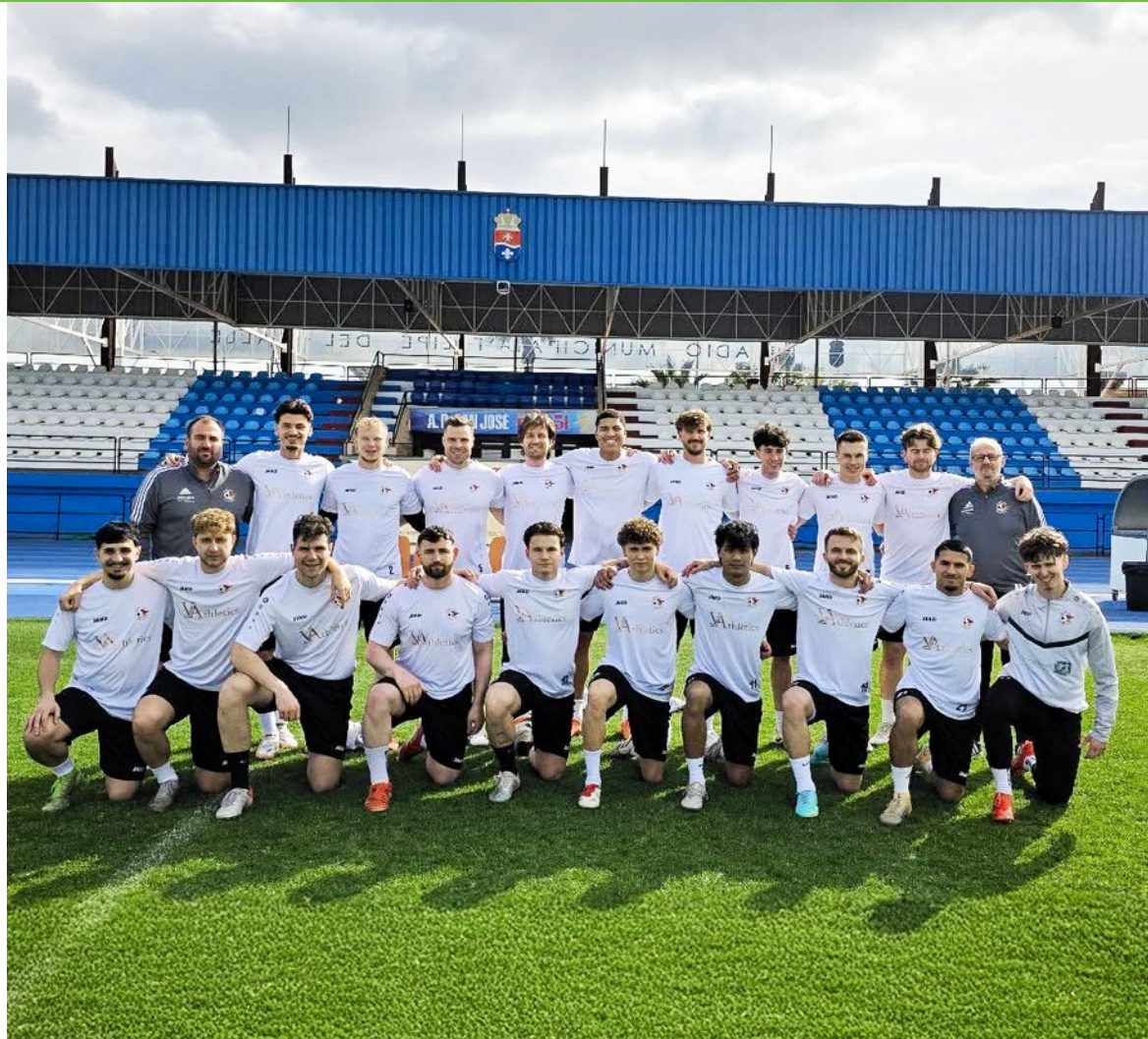
Nach einer langen und intensiven Vorbereitungsphase startete die erste Mannschaft mit einem Sieg gegen den FC Küttigen erfolgreich in die Rückrunde 2025/2026

Ich frage mich manchmal schon, wohin diese Entwicklung führt. Gleichzeitig bin ich überzeugt, dass wenn