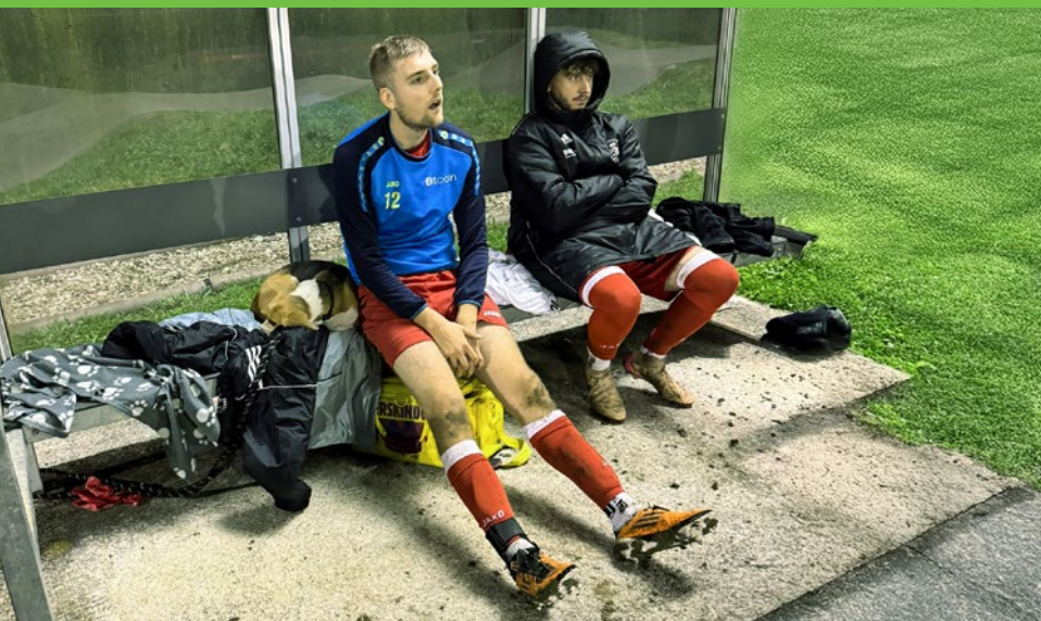
Zittern auf der Ersatzbank