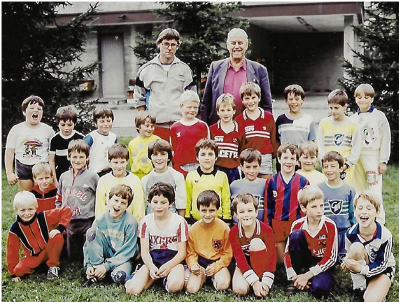
Junioren im Lager 1987