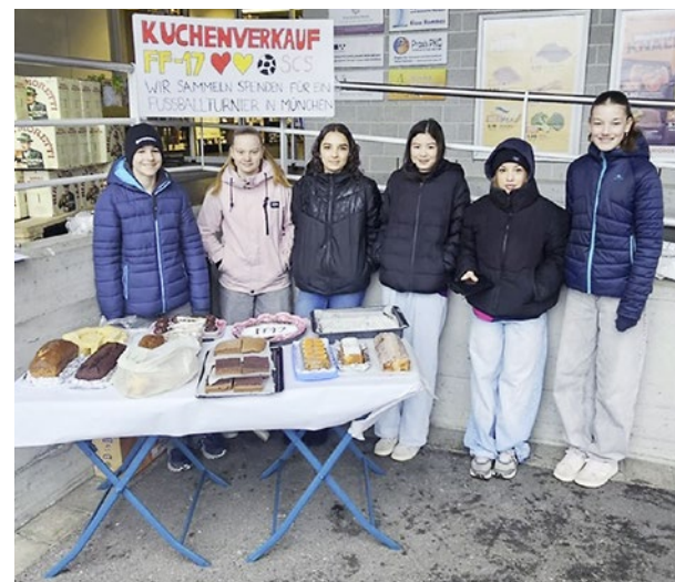
Kuchenverkauf Standort 2